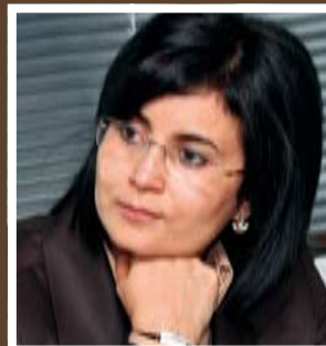
Fouzia Messaoudi Ministère de l'éducation